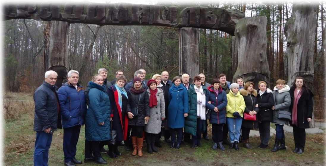
З'їзд Всеукраїнської асоціації шкіл ім.В.Чорновола

Мудрі слова. Тож, хай ця любов і надалі живе у наших серцях, шириться, передається один одному, наповнює всю нашу Україну!