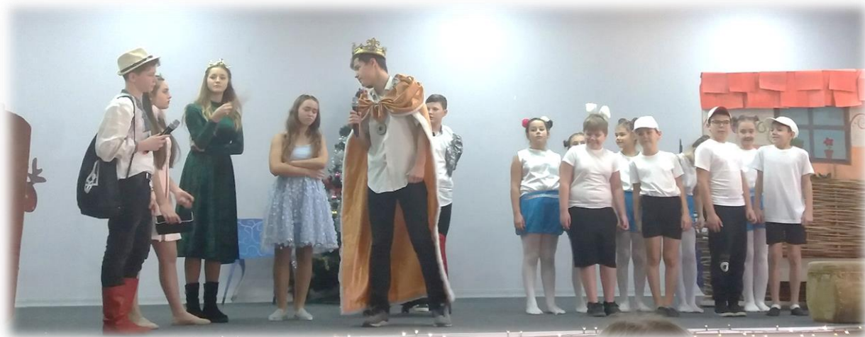
Фрагмент з новорічної вистави