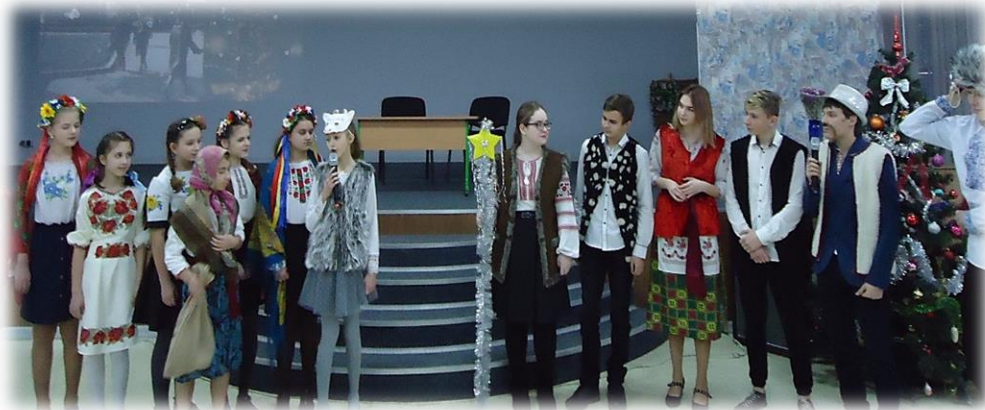
Фрагмент з вистави «В'ячеслав Чорновіл»