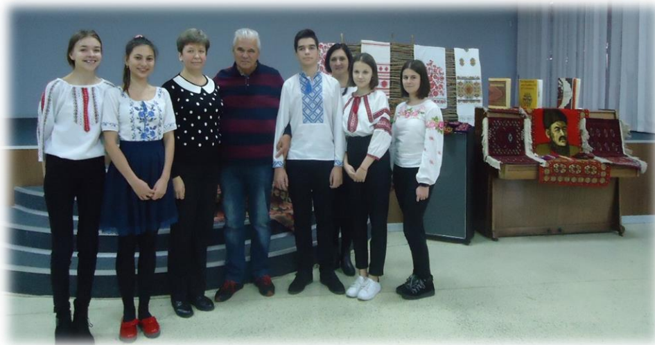
Спільне фото учасників і гостей заходу

До заходу було підготовлено книжкову виставку про килимарство та представлено зразки українських і туркменських килимів. Зокрема працівники бібліотеки принесли на виставку килим із зображенням портрету поета Туркменії Махтумкулі.