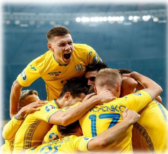
Збірна українських гравців

17 листопада наша збірна з футболу провела останній матч у 2019 проти Сербії (2:2) після фінального свистка цей матч дав нам декілька речей: