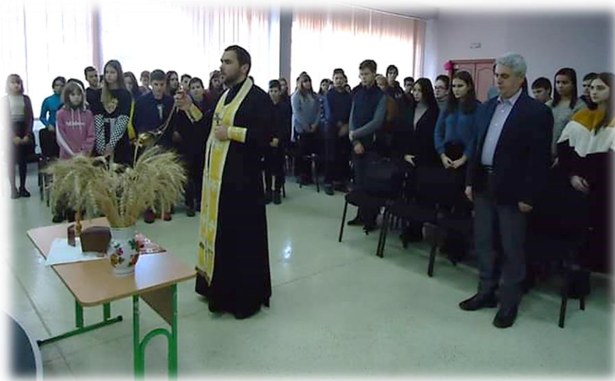
Спільна молитва за невинно убієнних

Гідним вчинком кожного свідомого громадянина буде вічна пам'ять про невинно убієнних і запалення свічки у суботу, 23 листопада.