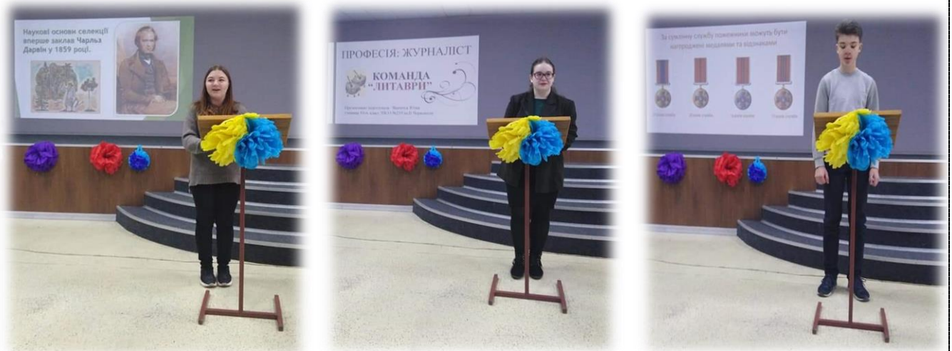
Фрагменти виступів учнів на педагогічній раді

Було обговорено питання раніше проведених спільних заходів (семінарів і конференцій, ділових ігор, написання дослідницьких робіт, проведення засідань педагогічної ради тощо) та перспективи подальшої співпраці.