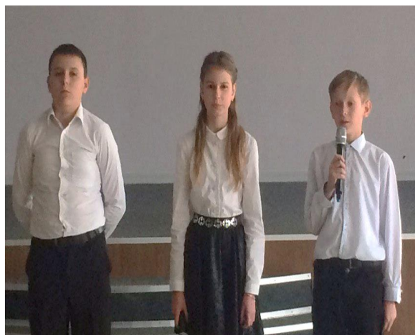
Виступи хору та учнів під час заходу