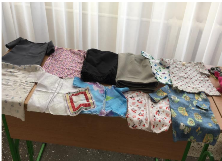
Виставка учнівських робіт