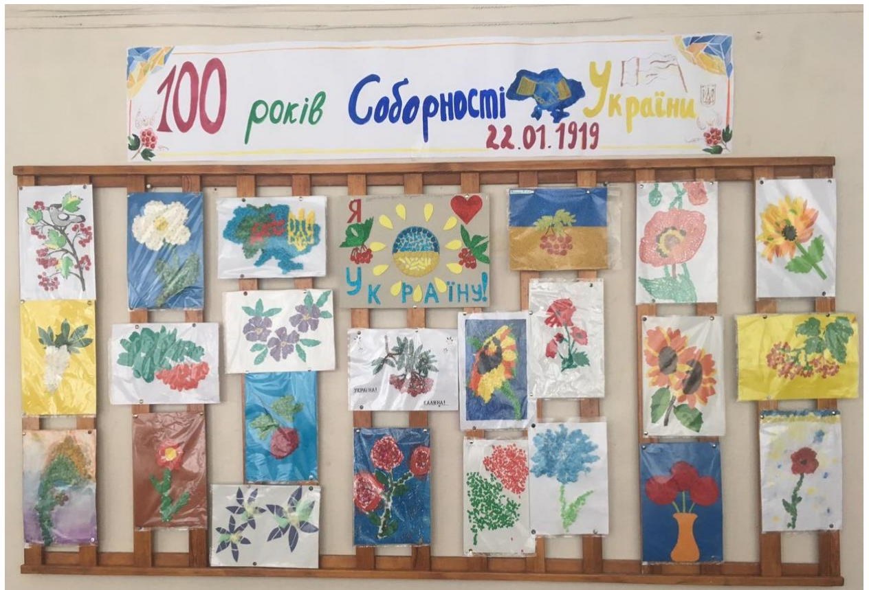
Фото з шкільної виставки

Наша школа не залишилась осторонь від цієї знаменитої події та підготувала виставку малюнків.